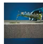
Säure- und chemikalien- beständig