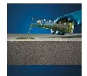
Säure- und chemikalienbeständig