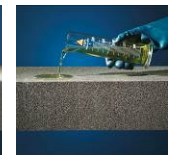
Säure- und chemikalienbeständig