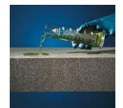
Säure- und chemikalienbeständig